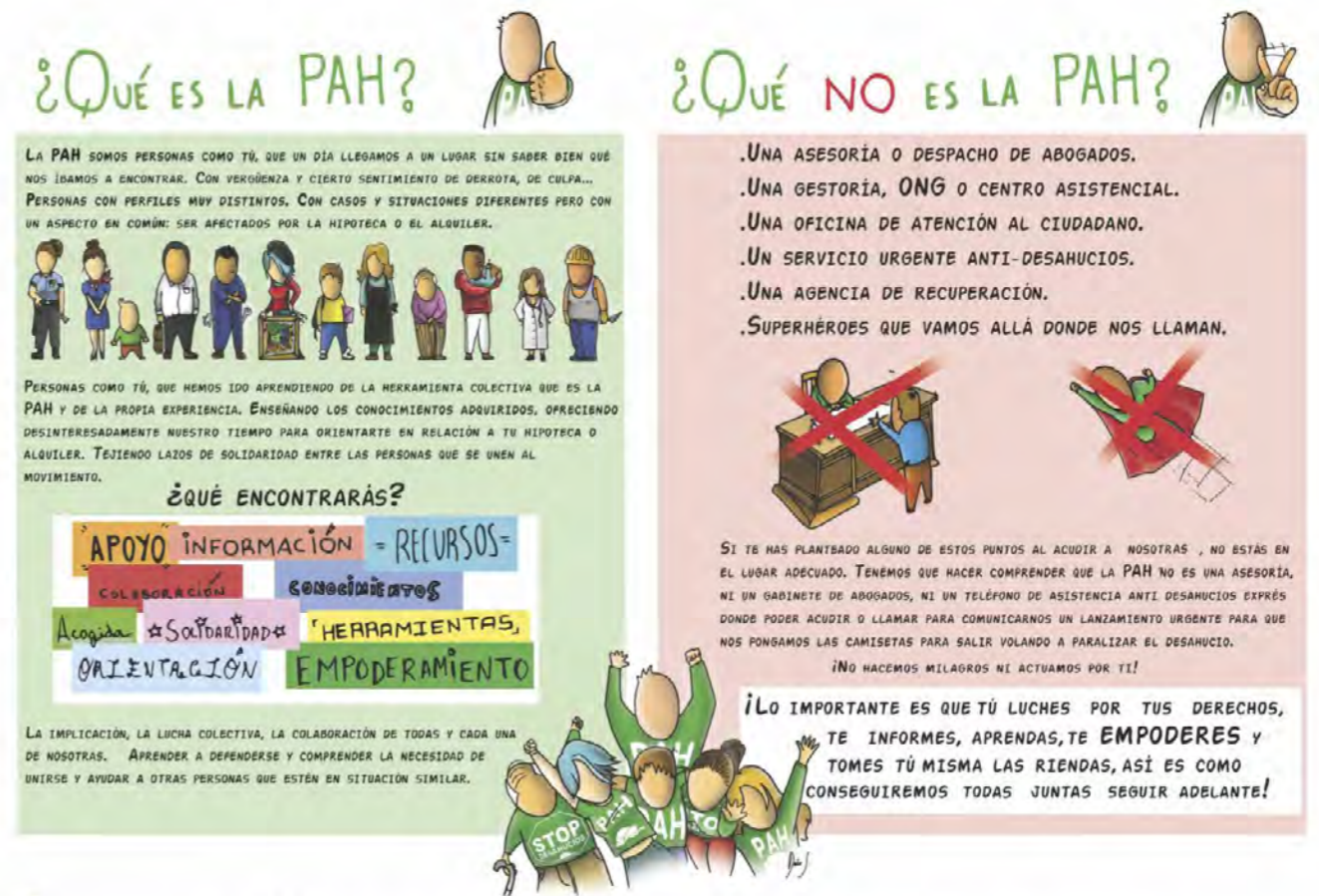
LA PAH ES UN MOVIMIENTO CIUDADANO PARA LA DEFENSA Y CONQUISTA DE NUESTROS DERECHOS