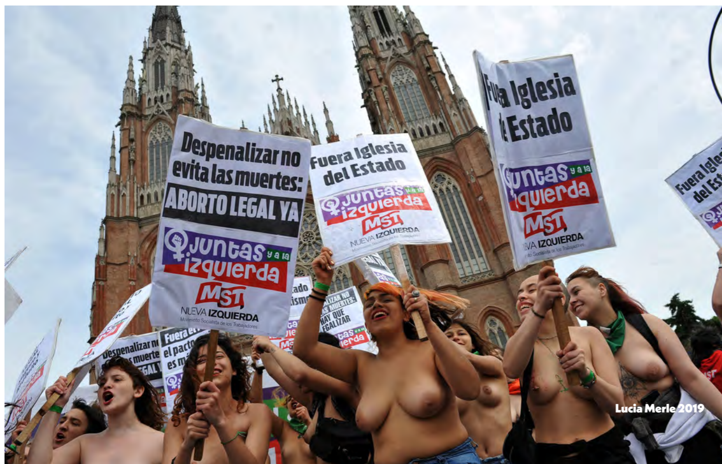
Lucía Merle 2019